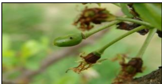
Fructe atacate de viespea cu ferăstrău