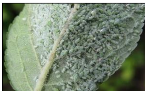
Afide pe frunză