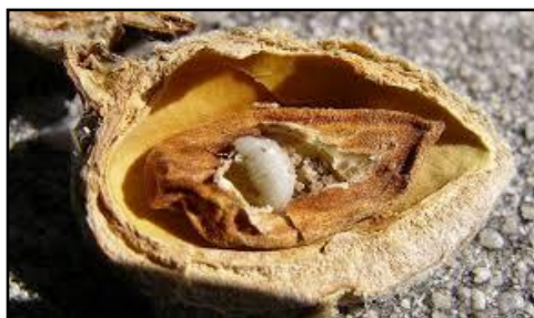
Larva viespei sâmburilor